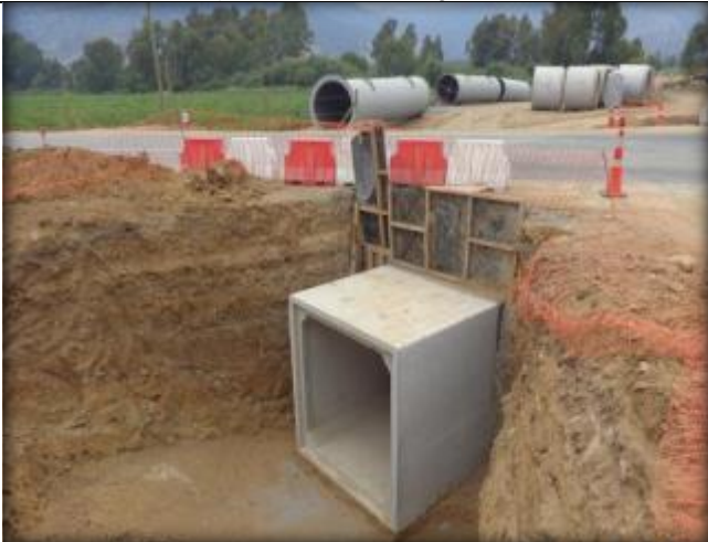
Colocación de cajón, canal de descarga a sifón, Ruta I-72.