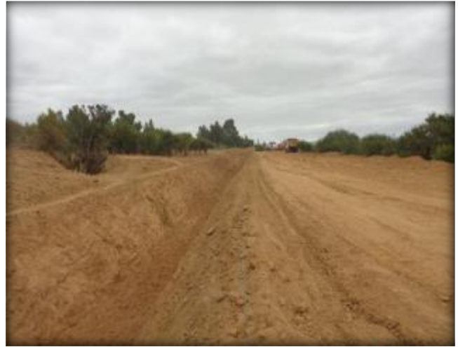
Corte de canal, Km 5,500.