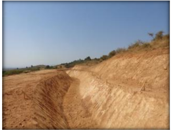
Corte de canal, Km 19,820.