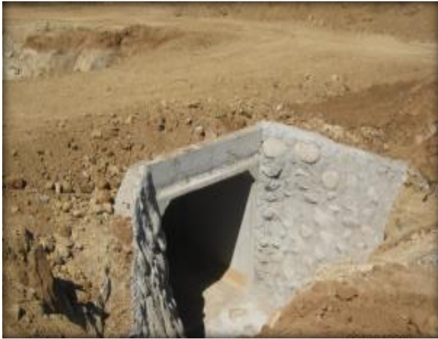
Mampostería de entrada y salida, acceso a predio, Km 41,810