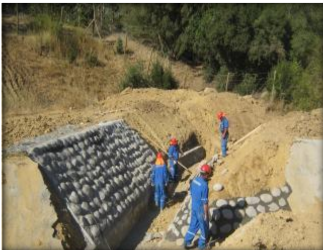
Mampostería en cruce de quebrada, Tipo CQ7, Km 14,785.