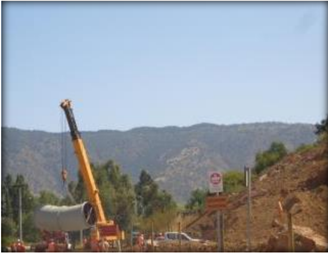
Montaje de codo, descarga a sifón.