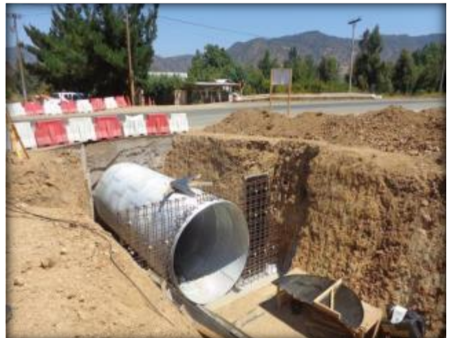
Enfierradura para muro de boca, Ruta I-72.