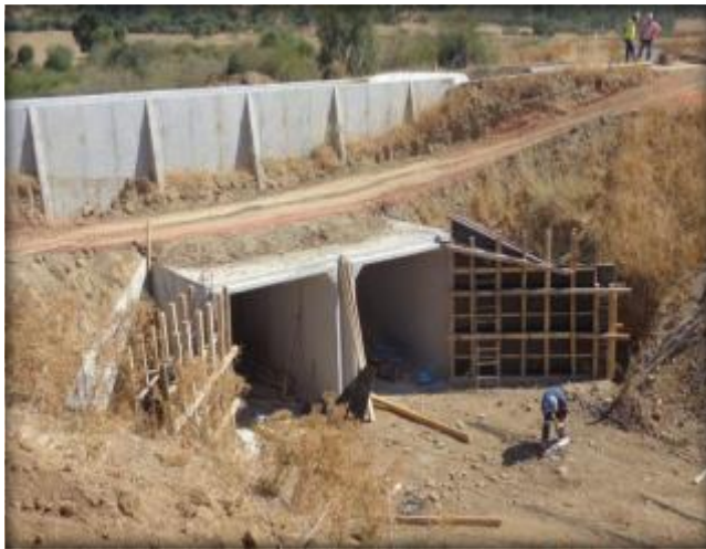
Moldajes para alas, Estero El Guaico, Km 8,600.