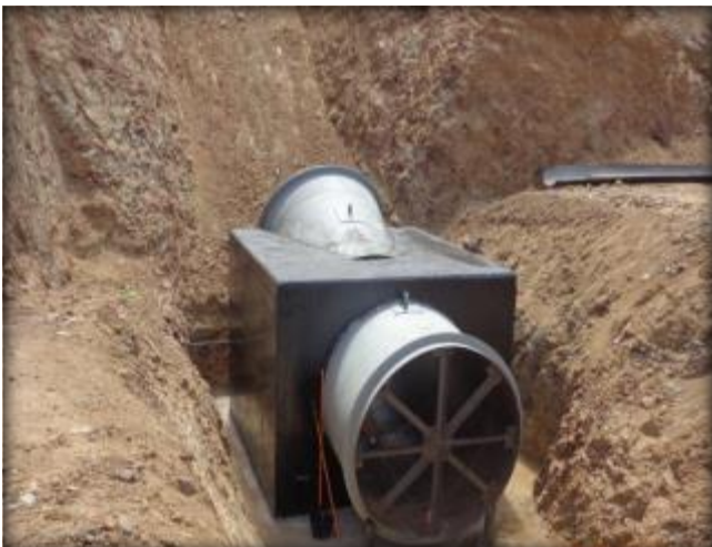
Dado de hormigón.