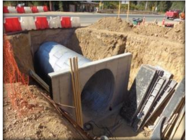
Hormigonado de muro de boca, Ruta I-72.