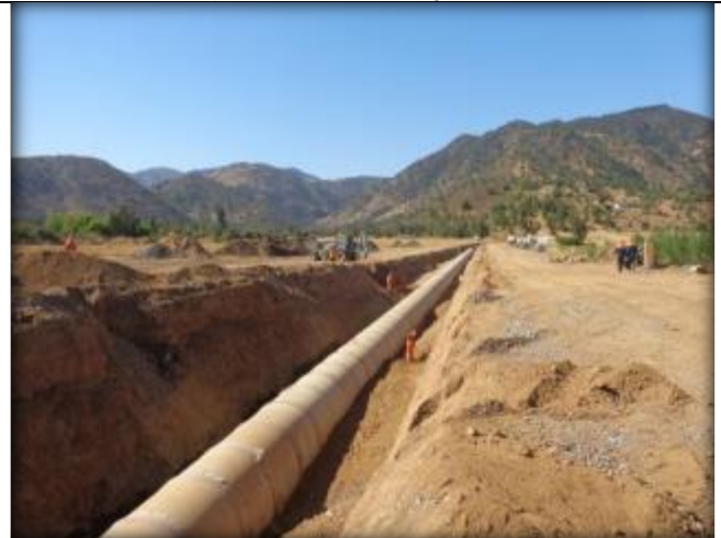
Relleno estructural para tubos prefabricados, Km 1,550.