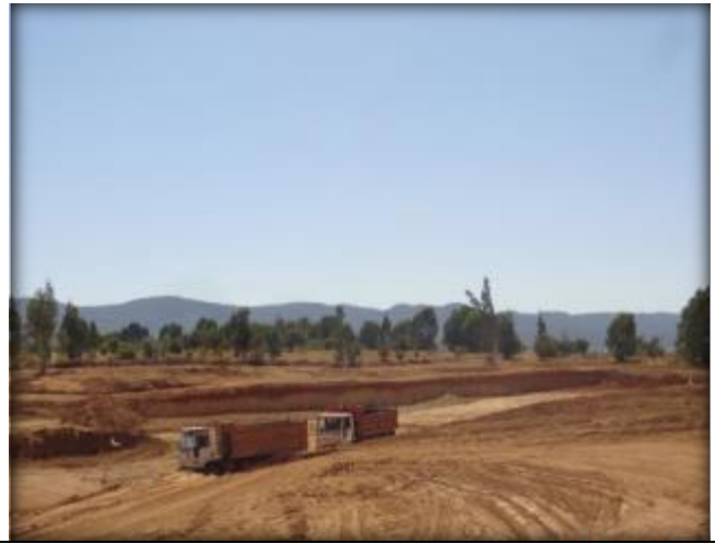
Movimiento de Tierras.