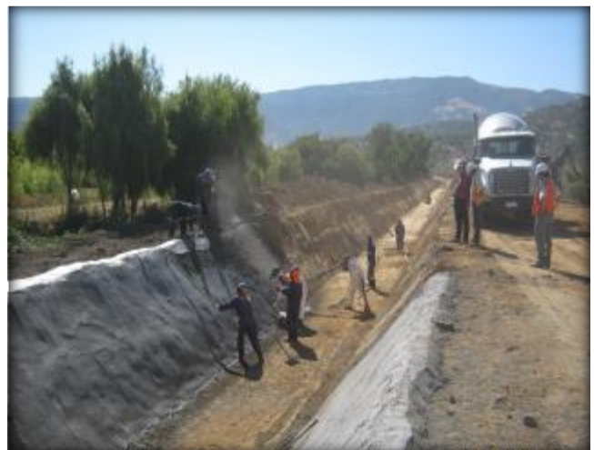
Hormigonado de canal, Km 1,450.