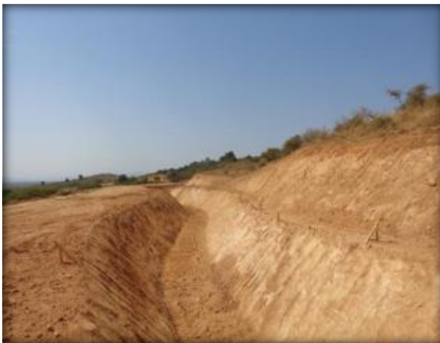
Corte de canal, Km 19,820.