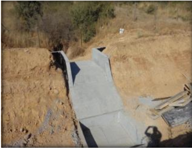
Descarga a canal, Km 15,420.