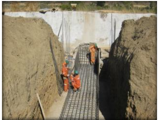
Preparación de enfierradura para obra de descarga, Estero El Guaico, Km 8,600.