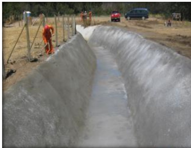
Mejoramiento -Revestimiento del canal, Km 1,600- Km 1,645.