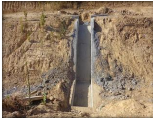
Descarga a canal, Km 14,840.