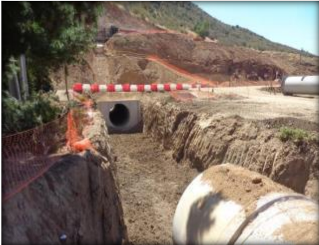
Excavación para tubos prefabricados.