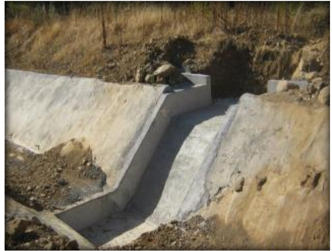
Descarga a canal, Km 14,460.