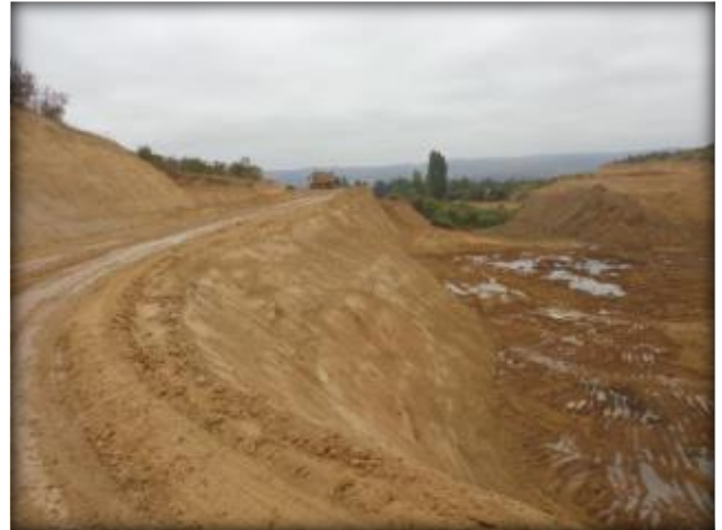
Preparación de plataforma para corte de canal, Km 35,040.