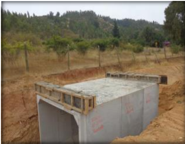
Colocación de cajón, Km 21,640.