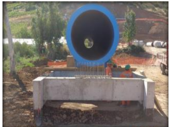
Relleno estructural, estribo de salida.