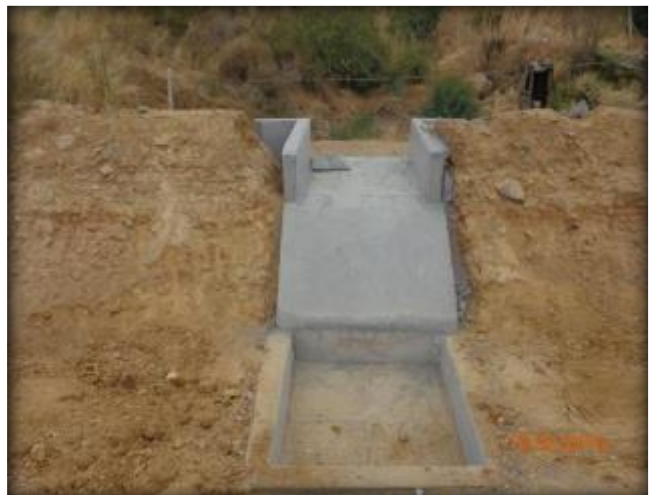
Descarga a canal, Km 15,405.