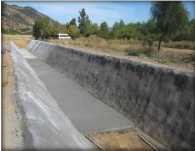
Hormigonado de radier, Km 5,520.