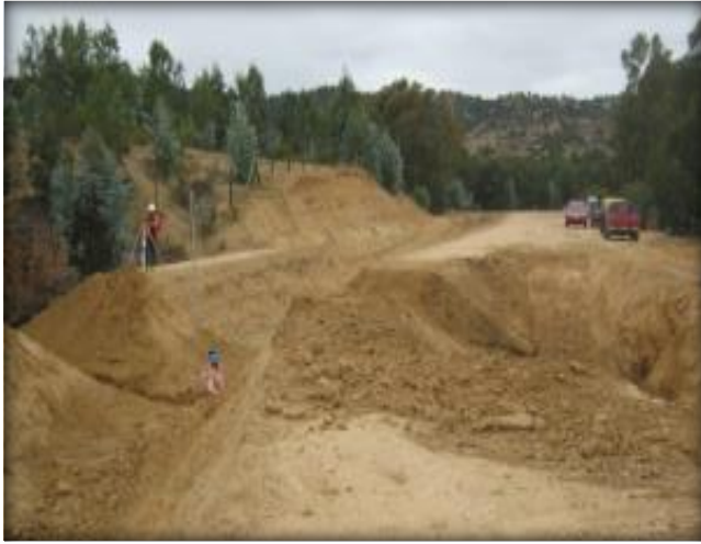
Excavación cruce de quebrada CQ7, Km 27,900.