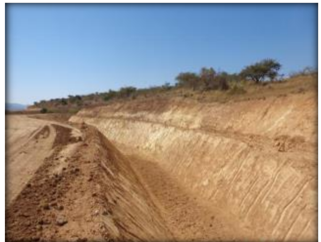
Corte de canal, Km 20,200.