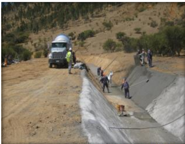
Hormigonado de canal, Km 5,600.