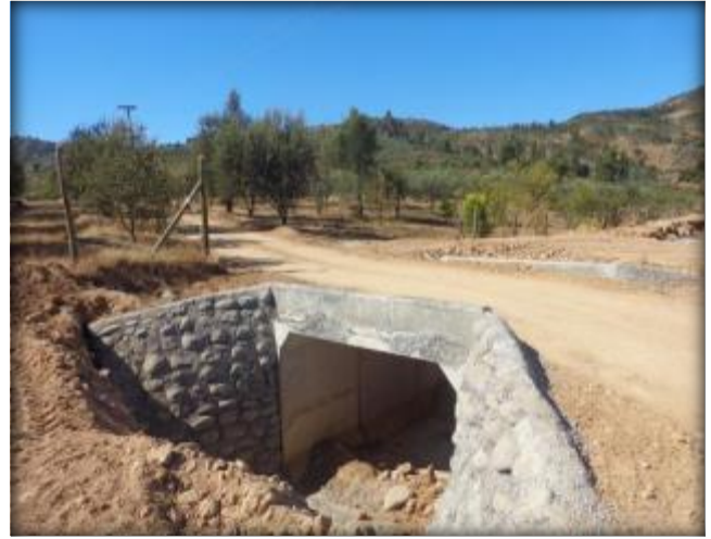
Construcción de paso predial, Km 27,089.