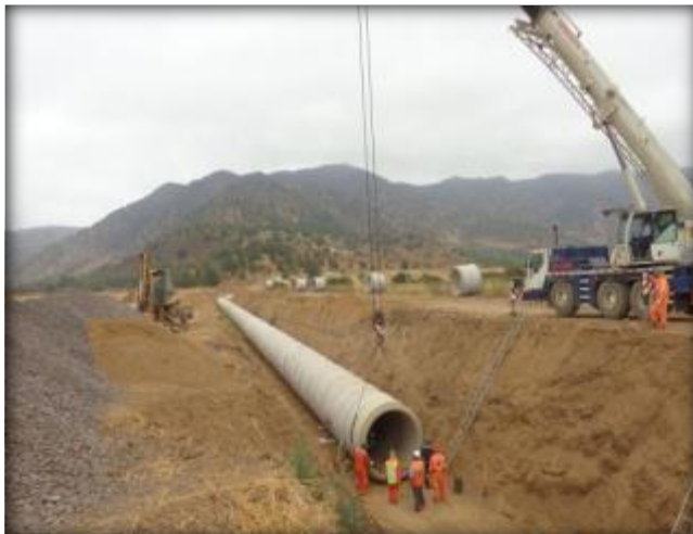
Montaje de tubos prefabricados, Km 1,520.