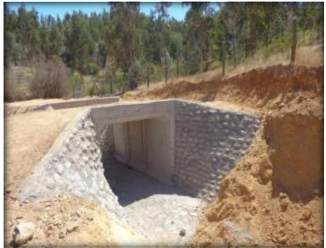
Mampostería de paso predial, Km 22,270.