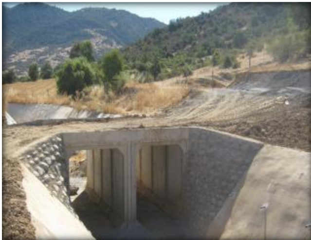
Mampostería entrada y salida de paso predial, Km 8,080.