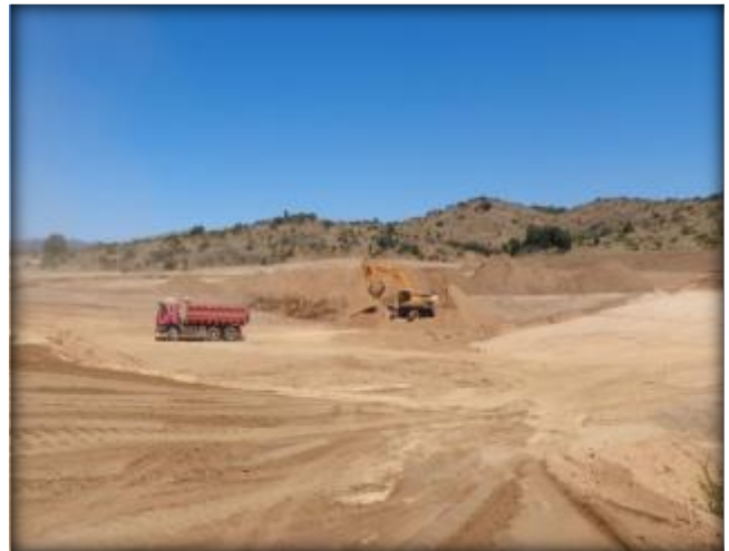
Movimiento de Tierras.