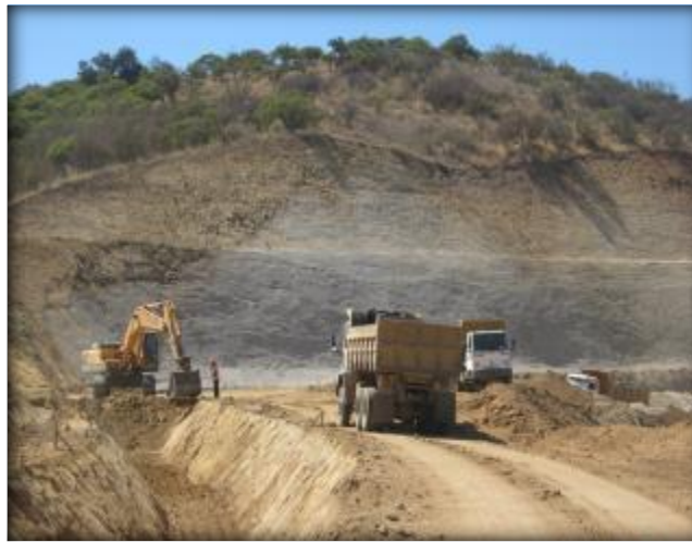
Corte de canal, Km 37,400.