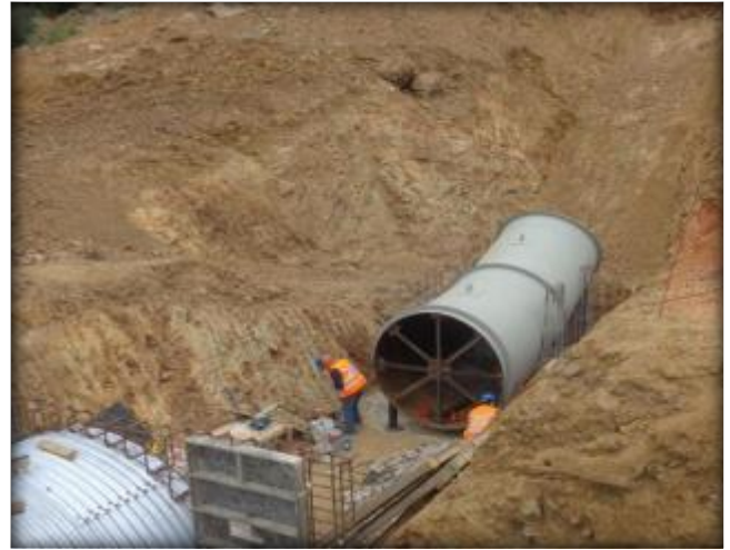
Montaje de codo, descarga a sifón.