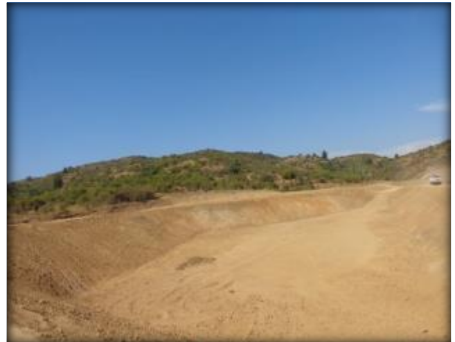
Movimiento de tierras.